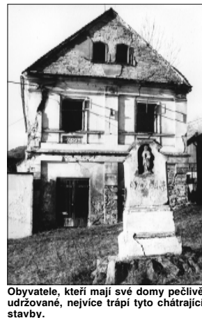
Obyvatelé, kteří mají své domy pečlivě udržované, nejvíce trápí domy chátrající stavby.