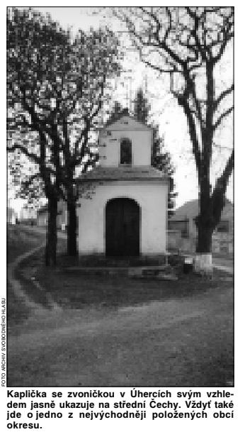
Kaplička se zvoničkou v Úhercích svým vzhledem jasně ukazuje na střední Čechy. Vzdýl také jde o jedno z nejvýhodnější položených obcí okresu.