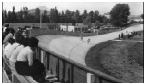
Lounský velodrom někdy v šedesátých letech.