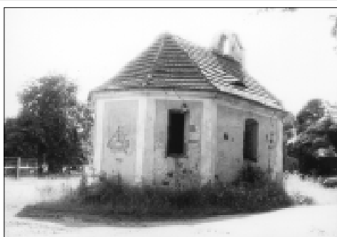
Kaplička ve Vescích není ani státem chráněnou kulturní památkou.