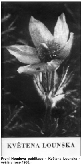
První Houdova publikace – Květena Lounska – vyšla v roce 1966.