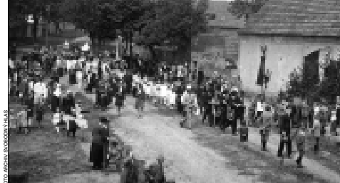
Průvod při Božím Těle v Lounech u kostela Čtrnácti svatých pomocníků v Lounech v roce 1928.

Jaká je historie tří jmenovaných církevních staveb, zasvěcených Čtrnácti svatým pomocníkům, si povíme přístě. Přístě: HOSPODNÍK-BEZDĚKOV