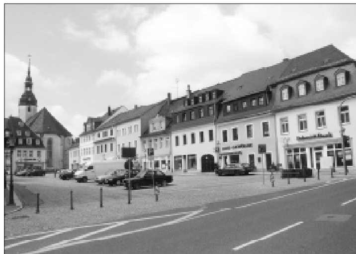
Zschopau, náměstí Neumarkt.

09.30 hodin Odjezd k prohlídce Peruce 11.30 hodin Oběd v penzionu U Dubu 13.30 hodin Návštěva výstavy Člověk v přírodě, vystoupení umělců z Zschopau 18.00 hodin Odjezd do Zschopau