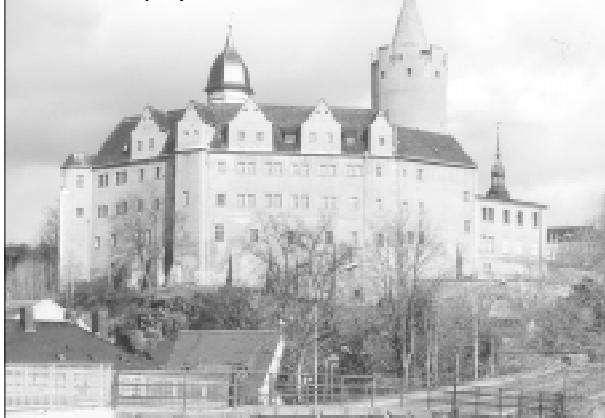
Zámek Wildeck od jihovýchodu.

09.30 hodin Jízda k návštěvě dolu 10.00 hodin Prohlídka dolu nebo návštěva koupaliště a nebo kuželky, popřípadě prohlídka města Společný oběd (ve stanu) 13.30 hodin Otevření výstavy u příležitosti 30letého výročí spolupráce mezi městy 14.00 hodin Návštěva slavnosti na zámekém dvoře, prohlídka zámku a muzea 18.00 hodin Odjezd do Loun