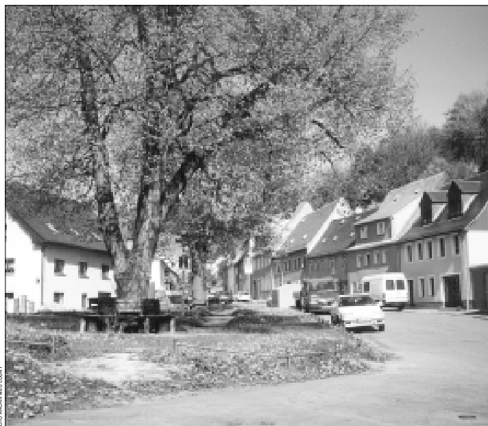
Zschopau, Luční ulice.

Doprovodným programem oslav se stane sportovní víceúčelová atletice, zúčastní se její žáci do 15 let z atletických týmů měst Zschopau a Louny. V průběhu oslavivymění starostové města dary. K 30letému jubileu partnerství jsou vydány pamětní mince, které bude možno zakoupit při oslavách jak v Zschopau tak v Lounech.