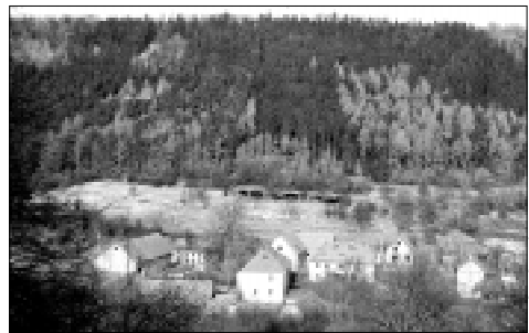
Náhorní plošina Dětaného chluMU připomíná savanu.

Chcete-li zblízka vidět, jak vypadá africká savana, nemusíte jezdit až do Afriky. Stačí navštívit přírodní rezervaci Dětaný chlum. Náhorní pláni této rezervace se vysokotělnou travou a soliterními většijká pokroutěnými duby se jivelemi podobá. Geologický podklad zde tvoří bazalt, který je součástí vulkanického komplexu Doupských hor. Za chráněné území o rozloze 35,6 ha byla vyhlášena již v roce 1967 a cílem je ochrana tepelníků doubravy enklávami stěpních trávníků s bohatou florou a faunou. Ze zajímavých rostlin zde nacházíme významné silně ohrožené konikleč luční český, vstavač muškový, dřín jámí, lilie zlatohlavá, zimozraček alpský a hvozdík