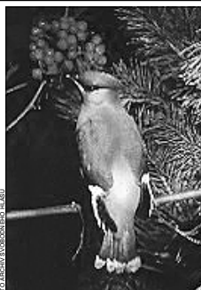
Brkoslav severní je vzácným zimním hostem, kterého lze na Dětaným chlumě zastihnout.

Je smutné hovořit o druzích, které se na Lounsku v minulosti vyskytovaly, nebo dokonce hnízditý jejich výskyt již nebyl v posledních letech zaznamenán. Je to například poštolka rudonohá, která v minulosti hnízдила u Rudoc a naposledy byla zastihena v roce 1975 u Toužetina. Podobná situace nastala i u některých kurovitých ptáků, jejichž centrem byla lesní oblast Džbánu alej okolí Hvízďalky, které navazovaly na lesní komplex Krávkolátu. O tetřevu hlušci je v minulosti znám mnoho údajů. Poslední údaj z roku 1970 hovoří o ojedinelém zastižení tetřevi slepice u Hvízďalky. Podobně lze hodnotit i výskyt lesního, který však ani v minulosti nepatřil na Lounsku mezi obecné druhy. Podle neověřeného údaje byl