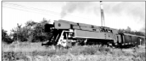
Týž přejezd o půl století později s historickým vlakem.