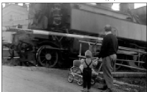
Železniční přejezd v Solopyskách v letech šedesátých.

Štydla se starostové z Podlesí báli, že místo do Loun to bude do Postoloprt. Rozhodli se proto stavbu finančně podpořit, na tehdejší dobu velkou část