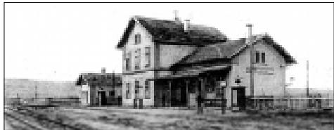
Nádraží v Domoušicích krátce po svém vzniku.

Přestože úřady nedoporučovaly žádné oslavy, pro většinu obcí bylo zahájení provozu událostí. „Paměťmi tento den označím všude téměř všechny vlastnostmi, vzrdor tomu, že obce správu dráhy vyvážly, aby se ode všech slavnost upustilo. Na veskeřích nádražích očekávan byl vlak věcí a kyticemi ozdobené zastupy obyvatelstva, které radost a nadšení své jasotem projevovale. Na některých stanicích zúčastni-