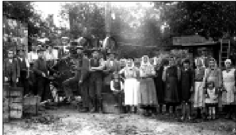
Nejstarší Úherčané z nejstarší fotografie Úherců, kterou se pyšní redakční archiv. Najdou se ještě pamětníci, kteří poznají obyvatele na snímku?

Nejstarší zpráva o Úhercích se sama hlásí k roku 1088. Je to mezi ostatními lounskými obcemi velmi unikátní, byť to není zcela jisté. Jde totiž o listinu vydanou až sto let později, jež se sama datuje do roku 1088. Je to jedna z velice zajímavých listin staré české historie. Týká se založení vyšehradské kapituly králem Vratislavem I. Právě Úherce jsou v této listině uvedeny jako jedna z obcí, které budou nové kapitule náležet. Není tam uvedena pouze samotná obec, jsou tam dokonce jmenována i vinaři - Pivona a Plac. Známe tak z jedenáctého století dva nejstarší Úherčany.“