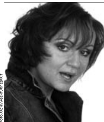
Hostem Divadelního plesu v Lounech je známá zpěvačka Petra Janů.