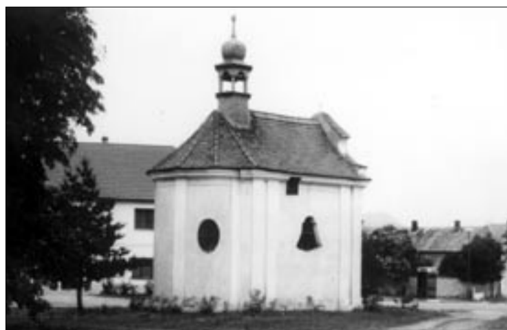
Kaple svatě Anny v Nečichách u Loun.

K této kapli, jejíž zařízení bylo už v minulosti zničeno, se váže zajímavá historie, dnes těžko ověřitelná. Měl totiž do ní být umístěn obraz svatě Anny Jiří zrušené dřevěné kaple, která stávala na vrcholu Oblíku. Jak se to mělo stát? Na vrcholu nedalekého Oblíku (509 metrů n.m.) stávala kdysi kaple svatě Anny, k níž se o pouti chodávalo ze širokého okolí. Zanikla ve třicetileté válce a později z ní byl jen kříž (1667), o který vedly obce pod vrchem dlouhé spory. V roce 1669 došlo navíc na Oblíku k velké rozeprá o právo podávat na slavnosti, spojené s poutí, pivo. Oprávo se hádali Lounští a Libčevští. Došlo to prý dokonce až tak daleko, že po sobě začali na vrchu střít.