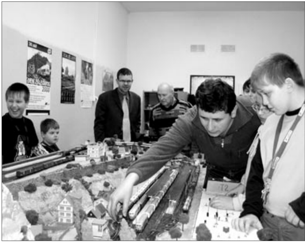
Až devět kluků najednou může pouštět vláčky a ovládat složitý systém kolejiště. Musí se však mezi sebou domluvit...

OKRES LOUNY (pěr) - Policisté zažili pestrý víkend, když vyšetřovali například případ důvěřivého seniora. 84letý pán pozval k sobě do bytu v Karlově ulici v Lounech dvě neznámé ženy. Přišly s tradiční záminkou výhry a rozměnění peněz. Podvodnice zjistily, kde má muž peníze a v nestrážném okamžiku je ukradly. Přišly k 21.000 korun. Dále se mezi obcemi Blšany a Černčice u Loun ztratilo 200 metrů měděného kabelu, vedeného podél komunikace a zaspaného v hloubce asi 30 cm. Sloužil jako bezpečnostní ochrana plynového potrubí. Škoda činí 14.000 Kč. V neděli 22. ledna kolem 14:15 hodiny došlo na Kruhovém náměstí v Žatci k dopravní nehodě mezi Škodou 105 a 40letým chodcem. Šestnáctiletý mladík za volantem škodovky odbočoval od náměstí Svobody vpravo do Nákladní ulice, když na přechodu předkem srazil podnapilého muže a poranil mu nohu. „Neřidič“ zraněného chodce, který si nepřál nehodu hlásit policii, naložil do auta a odvezl domů. Později policisté zjistili, že byl chodec pod vlivem alkoholu a mladík ještě ani nevládní řidičský průkaz.