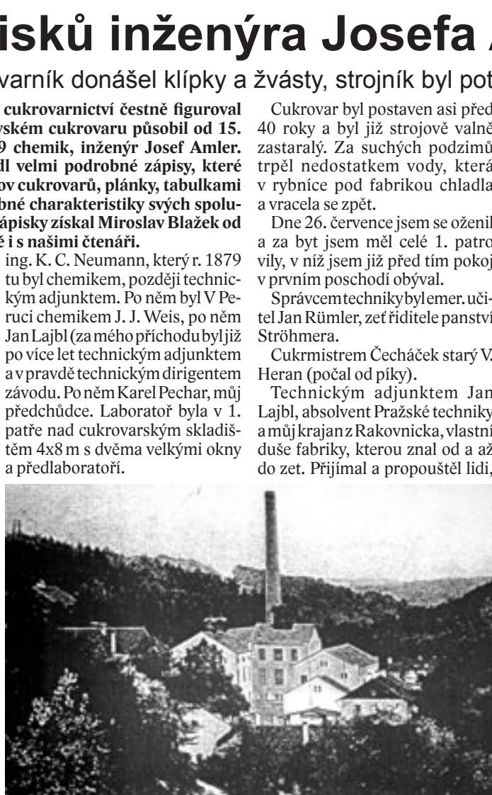
Perucký cukrovar v době své největší slávy.