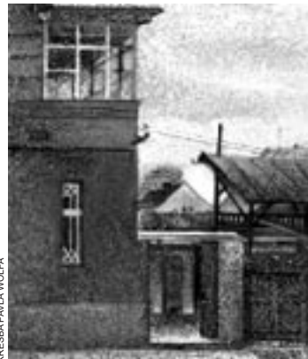
Zadní část hospodářské záložny – dům čp. 25 se vchodem a verandou od Mičurinovy (dnes Hlubanské) ulice, kde za méně reformy v roce 1953 hlídali vchod vojáci a z verandy si telefonovaly kamarádky přes ulici.