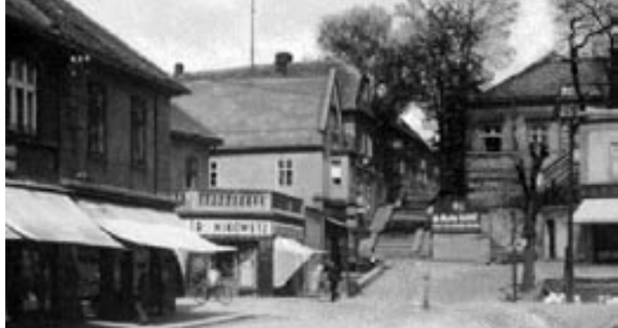
Dobový pohled Podbořan s křížovatkou pod kostelem a s obchodem firmy Mikowetz.

kárem Pekou. Sportovci netušili, co přijde za pár roků; že ona kulisa vojáků bude nakonec symbolem zmařených padesáti milionů životů lidí a že budou nenávratně zničeny mnohé cenné památky.