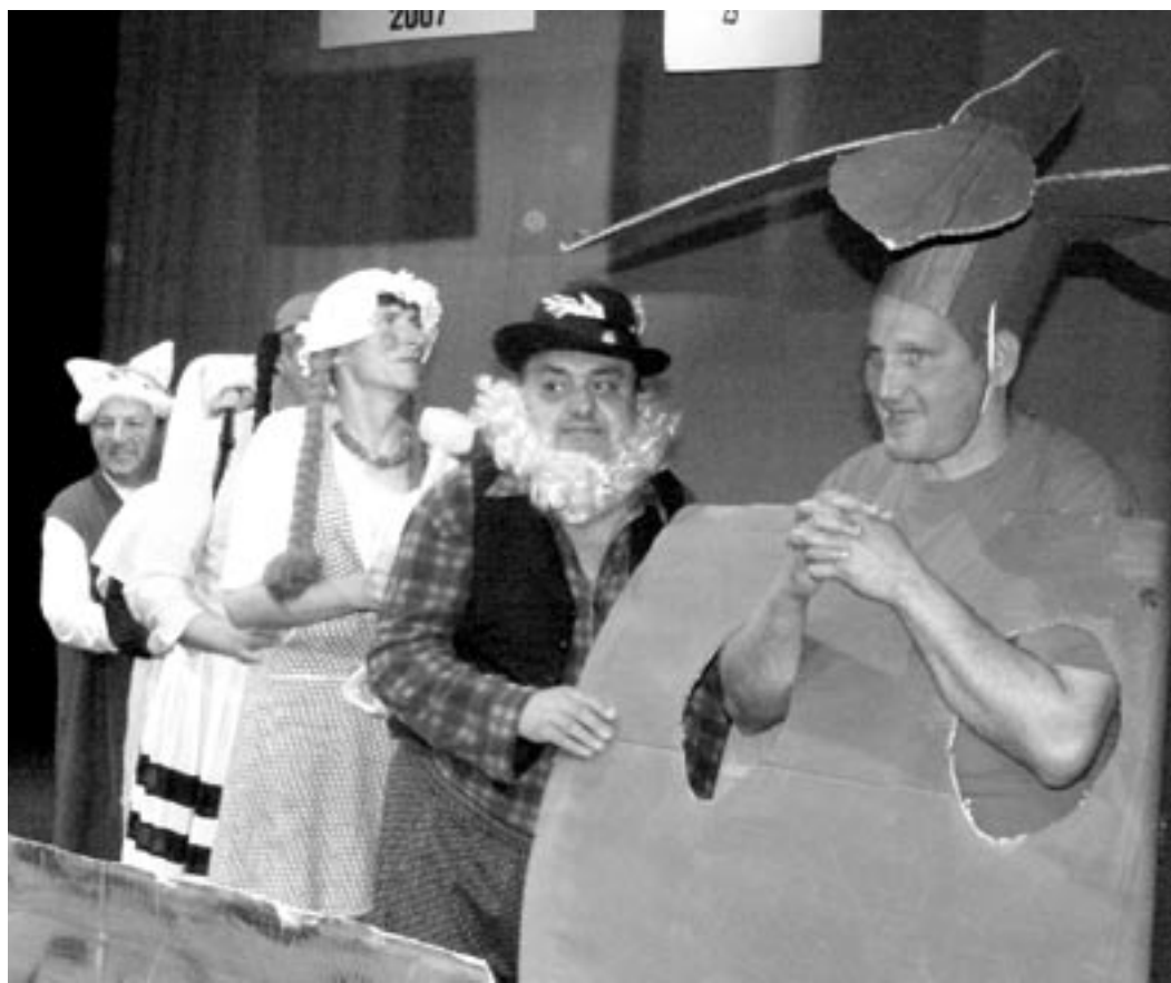
Herci z Ústavu sociální péče Tuchořice: dědek chytil řepu, babka dědka, vnuček babku, vnučka vnučka, pesek chytil za vnučku, kočička za pejska.