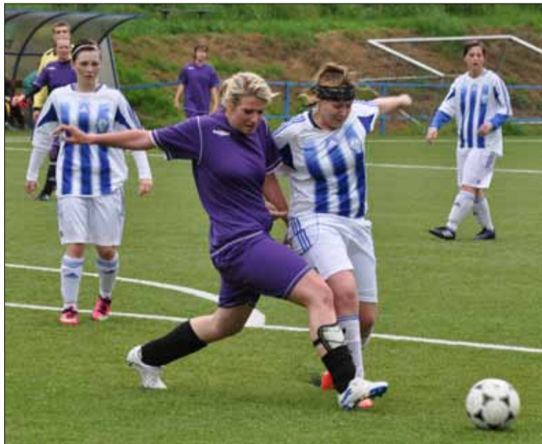
Obrana Ervěnic nedokázala odolávat útokům a kombinační hře postoloprtských děvčat.

hry ve středu zálohy. Stalo se tak díky do druhého poločasu naskočivší Bauerové a také vyloučení