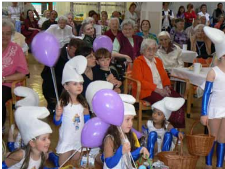
Děti a senioři uplynulou sobotu prožili nejen krásný okamžik.